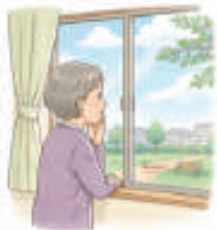
外出の機会が減った

日々の暮らしの中で、「少し気になる変化」を感じることはありませんか。例えば、外出の機会が減った、つまずきやすくなった、食事の量が減った、人と話すのがおっくうになった——こうした小さな変化は、加齢による自然なものと思われがちですが、実は介護予防の大切なサインであることがあります。