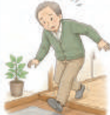
つまずきやすくなった