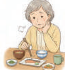
食事の量が減った