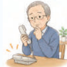
人と話すのがおっくう