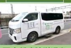
西京都病院送迎車