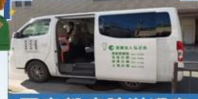
西京都病院送迎車